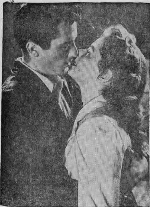
LA INTRIGA DEL DIA! ¿QUE ES

A las 7.30 ..... C 0.60 David Silva, en: EL AMOR ABRIÓ LOS OJOS